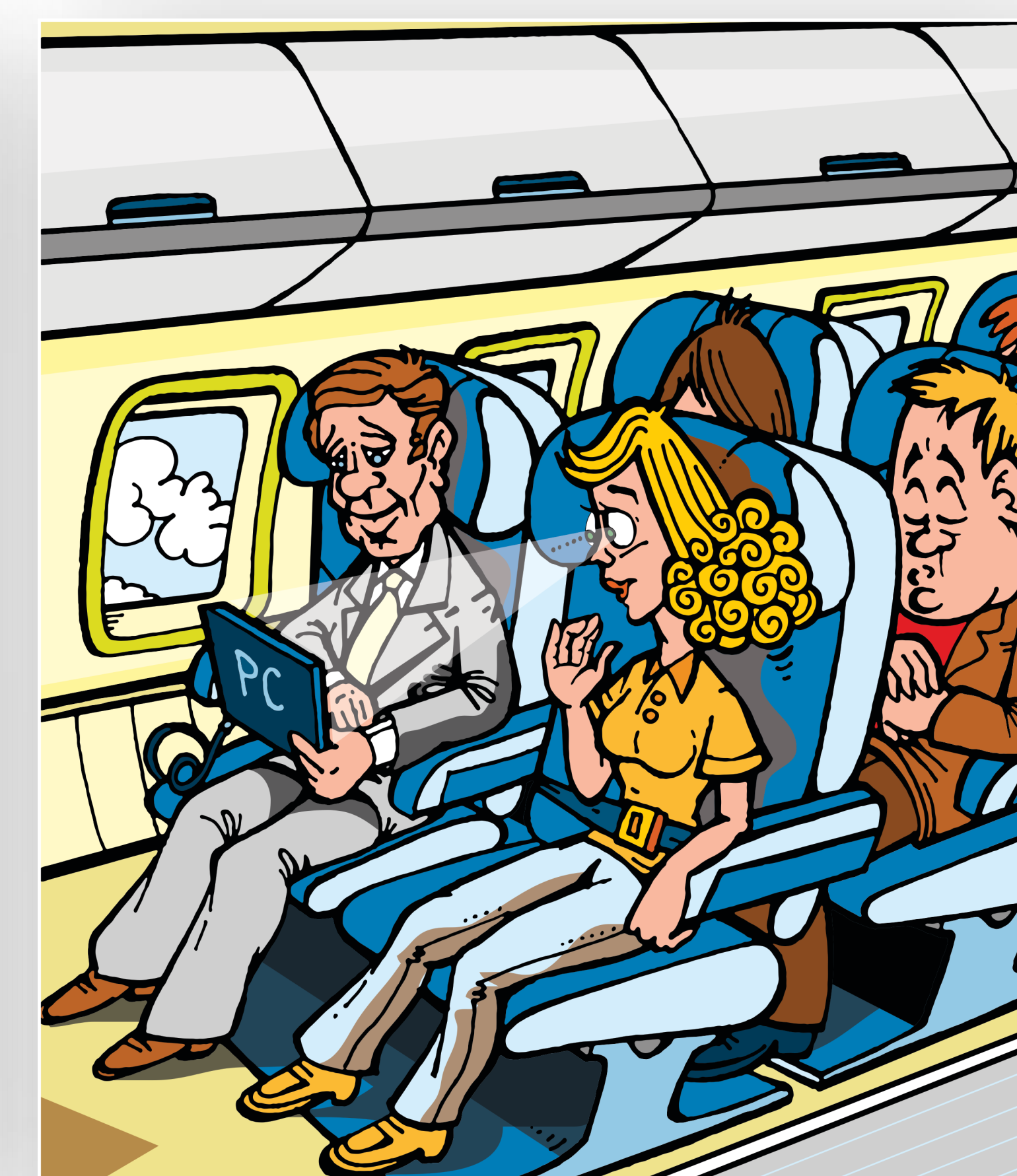
Radite i dok putujete? Budite oprezni!