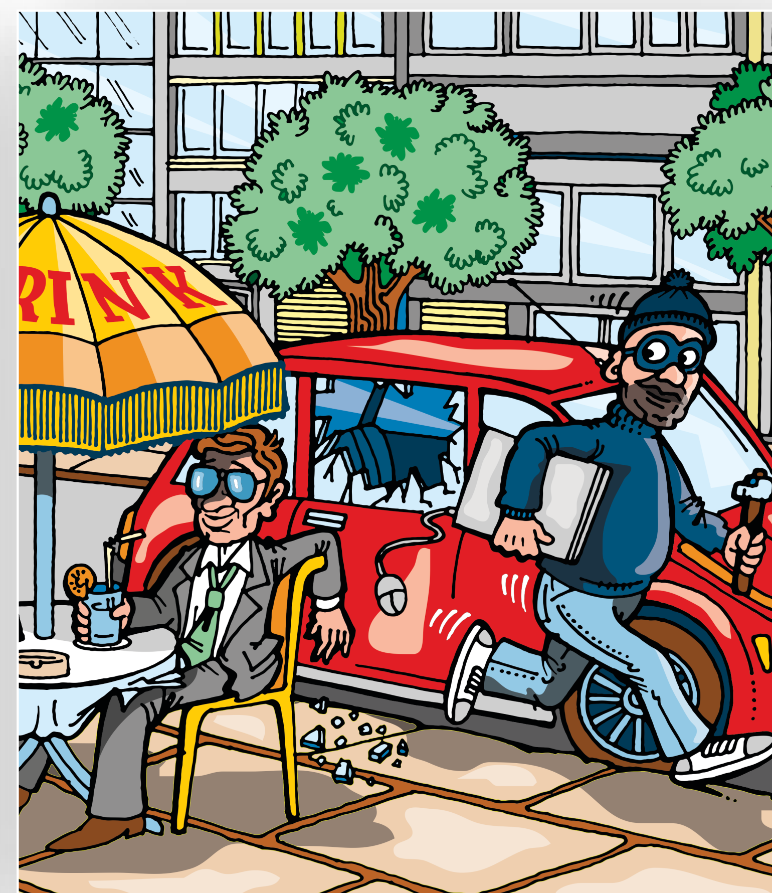
Ne ostavljajte vaš laptop na vidljivo mjesto u autu!