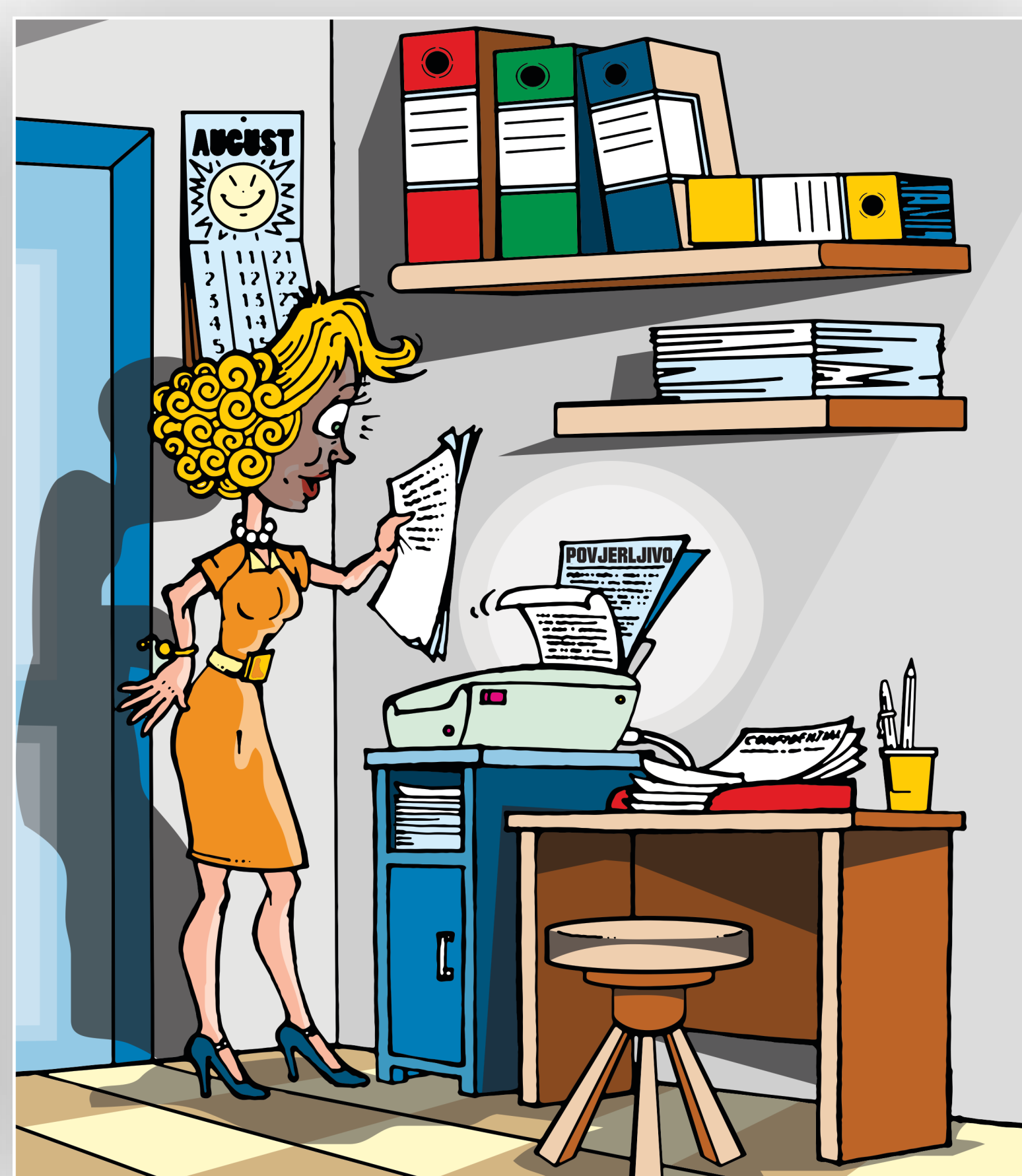
Ako to nije neophodno izbjegavajte štampanje tajnih podataka!