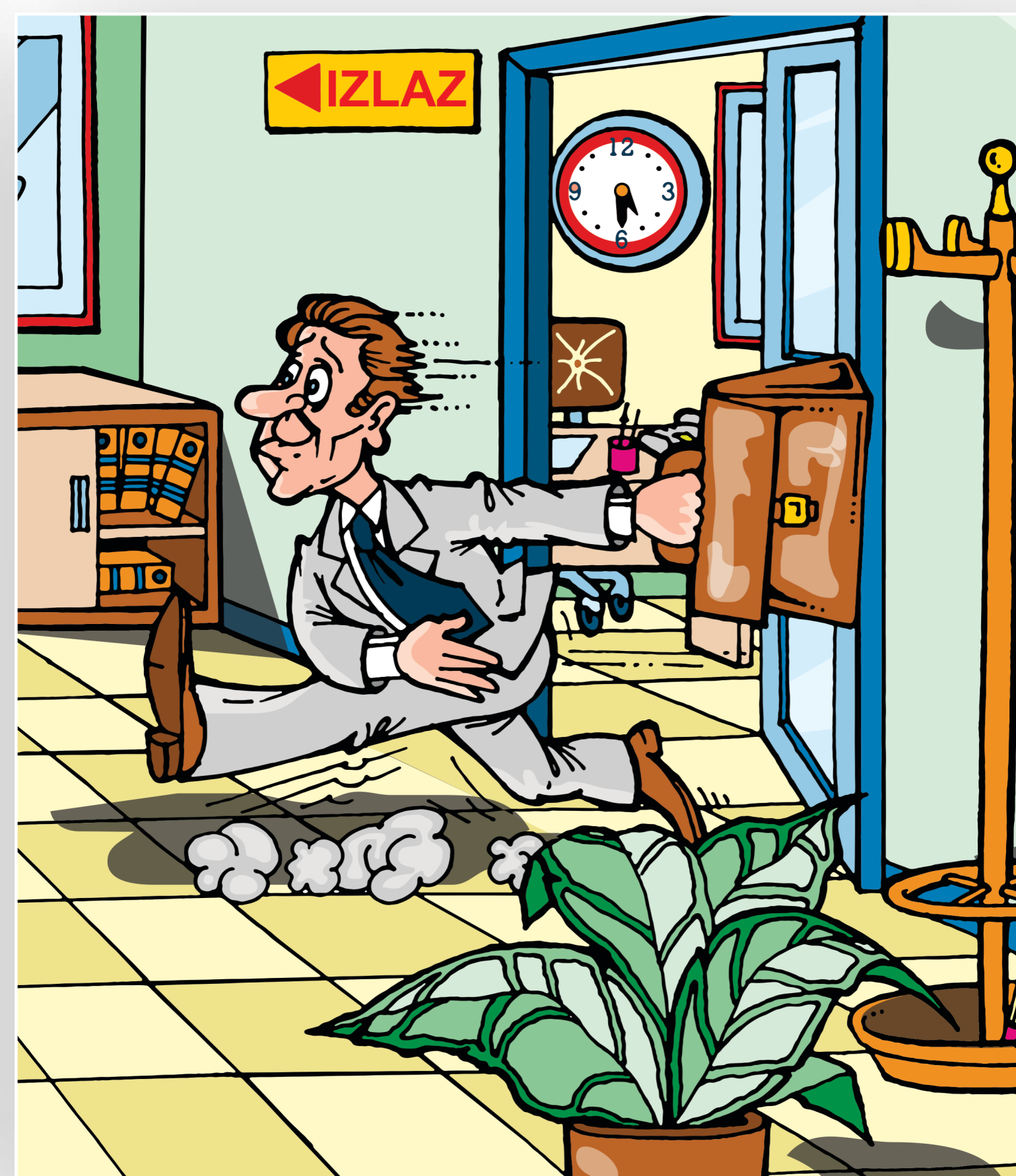
Idete kući? Odjavite se sa računara i uredno ga ugase!