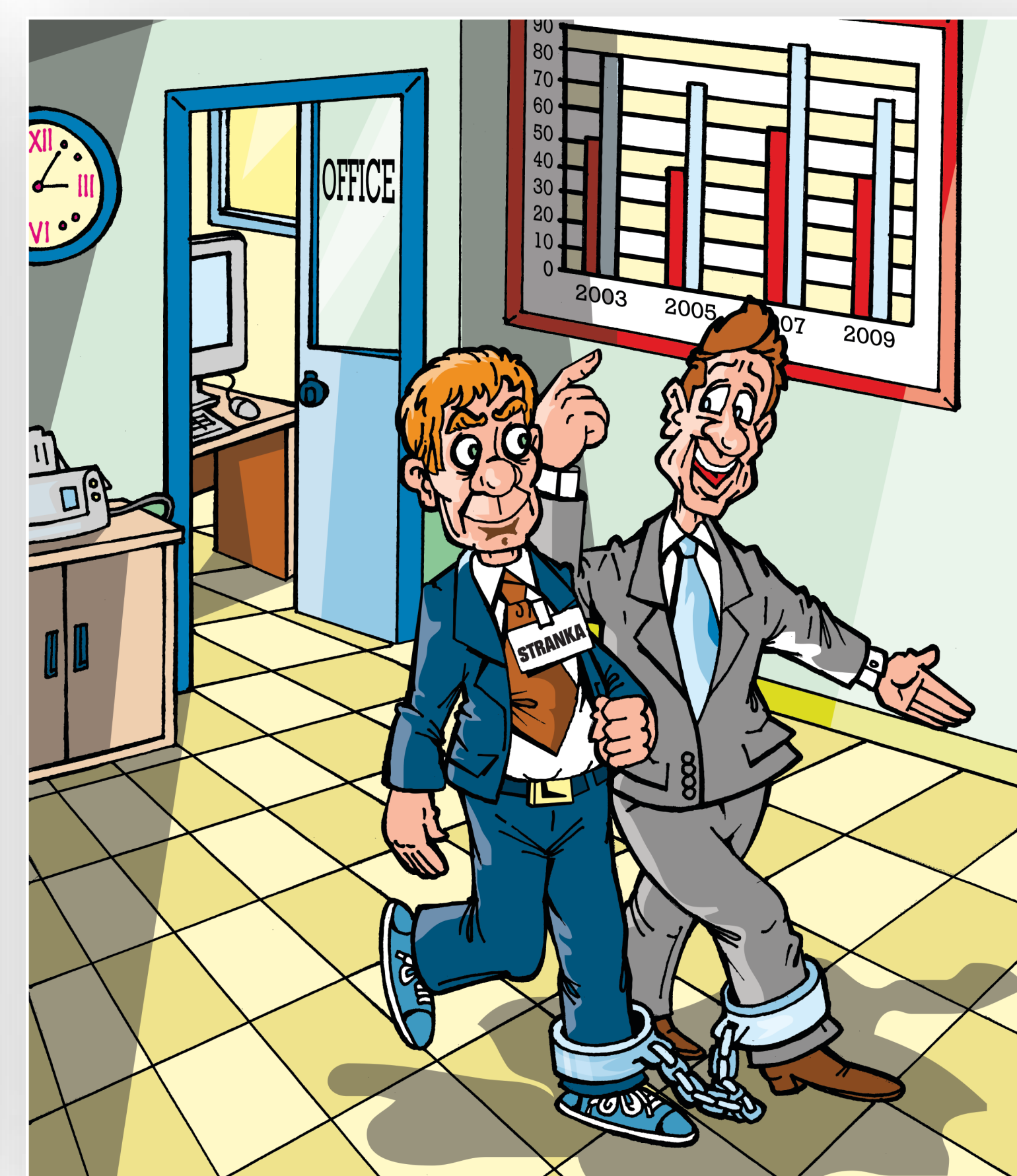
Stranke treba da posjeduju posebnu akreditaciju i da imaju pratnju cijelo vrijeme boravka u zgradi!