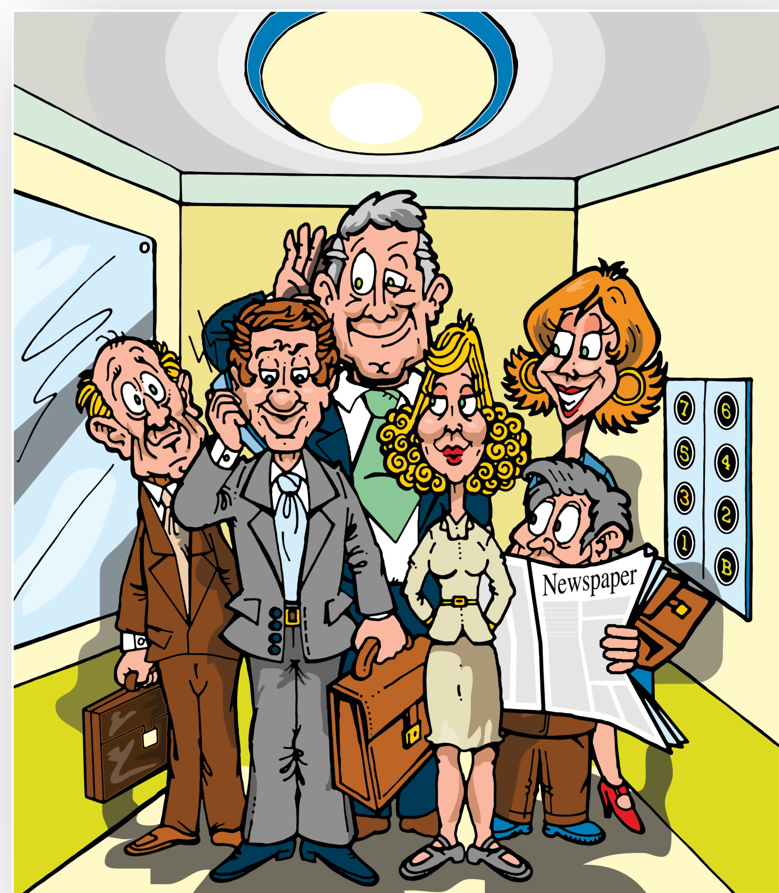
Povjerljive informacije ne trebaju biti dostupne svima!